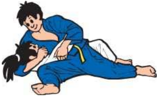
Zwei Ausführungen von Kesa-gatame