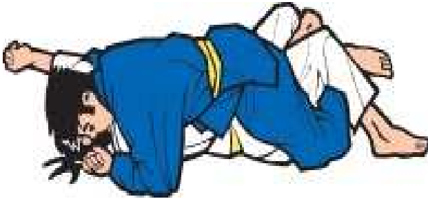
Zwei Ausführungen von Tata-shio-gatame