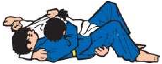
Zwei Ausführungen von Yoko-shio-gatame